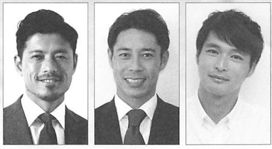
鈴木 啓太氏 (サッカー元日本代表) 成岡 翔氏 (U-17、U-20 元日本代表) 青山 隼氏 (U-17、U-20 元日本代表)