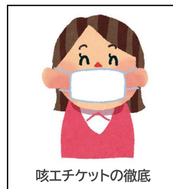
咳エチケットの徹底