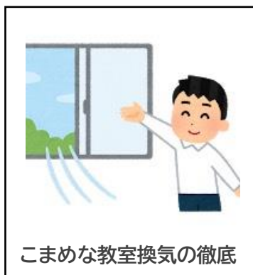
こまめな教室換気の徹底