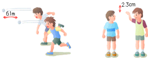
身長・基礎的運動能力の比較